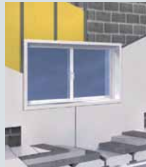
► Isoler par l'intérieur et enduire à l'extérieur avec weber.pral

Les produits et systèmes Weber sont conformes aux normes et bénéficient du marquage CE et/ou selon les gammes, d'Agréments Techniques Européens, de Documents Techniques d'Application (D.T.A.) édités par le CSTB, d' Avis Technique ou de Certificats comme pour les enduits de murs : CSTB CERTIFIED (voir pages 45 à 47).