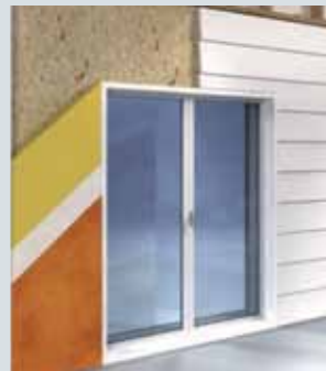
► Isolation répartie (exemple M.O.B.) avec weber.therm XM