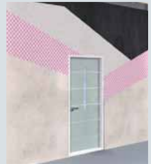
► Isoler par l'extérieur avec weber.therm