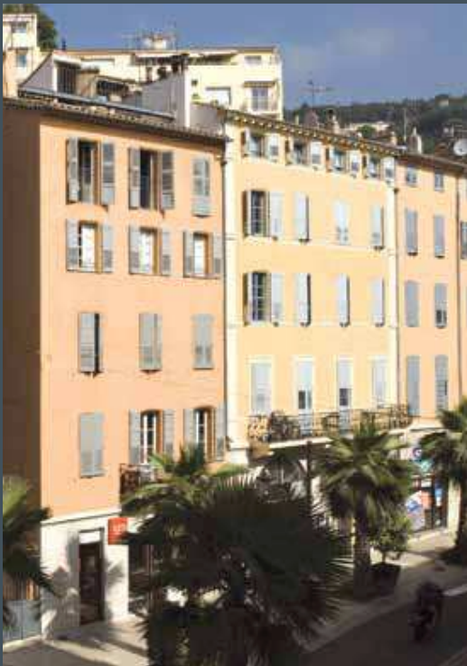
► Pierre Lorin architecte