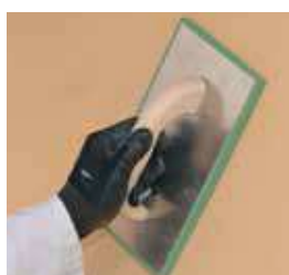
► Aspect ribbé