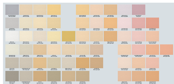
► Nuancier pages 72 à 75

Épousant les mouvements irréguliers des supports ou masquant les petits reliefs des anciens enduits minéraux, ces revêtements sont particulièrement appréciés pour la surépaisseur discrète qu'ils engendrent lors de la rénovation d'anciens enduits minéraux ou en couche de finition des systèmes d'isolation thermique par l'extérieur.