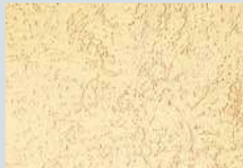
enduit mince à la chaux aérienne weber.unicor DPP ribbé ton pierre 016 NCS S 0705-Y40R