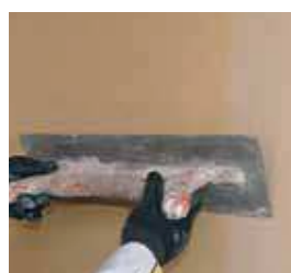
► Aspect taloché bâti ancien