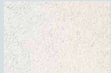
enduit mince à la chaux aérienne weber.unicor G taloché blanc 000 NCS S 0502-R