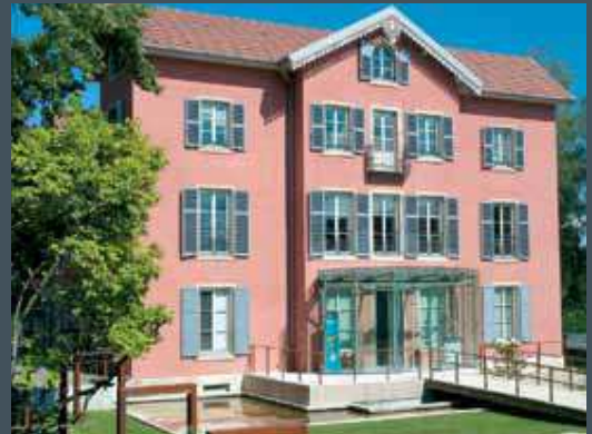
► Agence Lhomme et Nectoux architectes