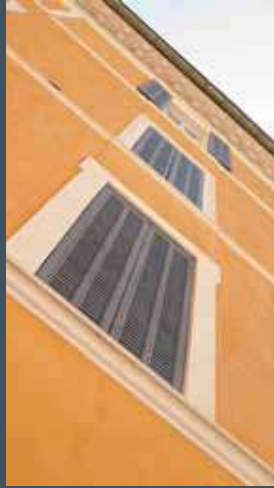
► Agence Lhomme et Nectoux ► Pierre Lorin architecte