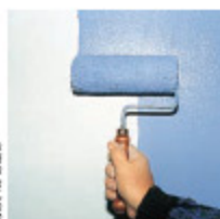
Colori A. Weber

En fine épaisseur, mis en œuvre manuellement avec les techniques traditionnelles du peintre, ces revêtements s'appliquent au rouleau.