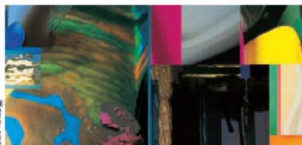
Colori G. Maggi

Revêtement semi-épais d'imperméabilité tramplast Destiné exclusivement à la rénovation des façades fissurées, tramplast est un matériau technique au fort pouvoir opacifiant dont le nombre de couches et les épaisseurs d'application sont réglées par la norme P 84-403 selon les classements des systèmes 1 à 4. La gamme de teintes de référence est également celle des 220 teintes organiques pigmentées.