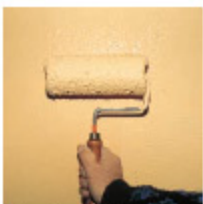
Système d'imperméabilité tramplast 2