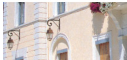
Patine sur plâtre en accompagnement de l'enduit